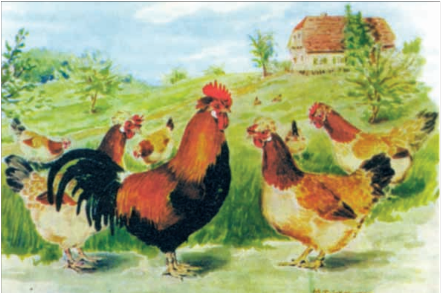
Baron von Twickel porträtierte die Superhühner und nannte sie „Kinder des Südens.“