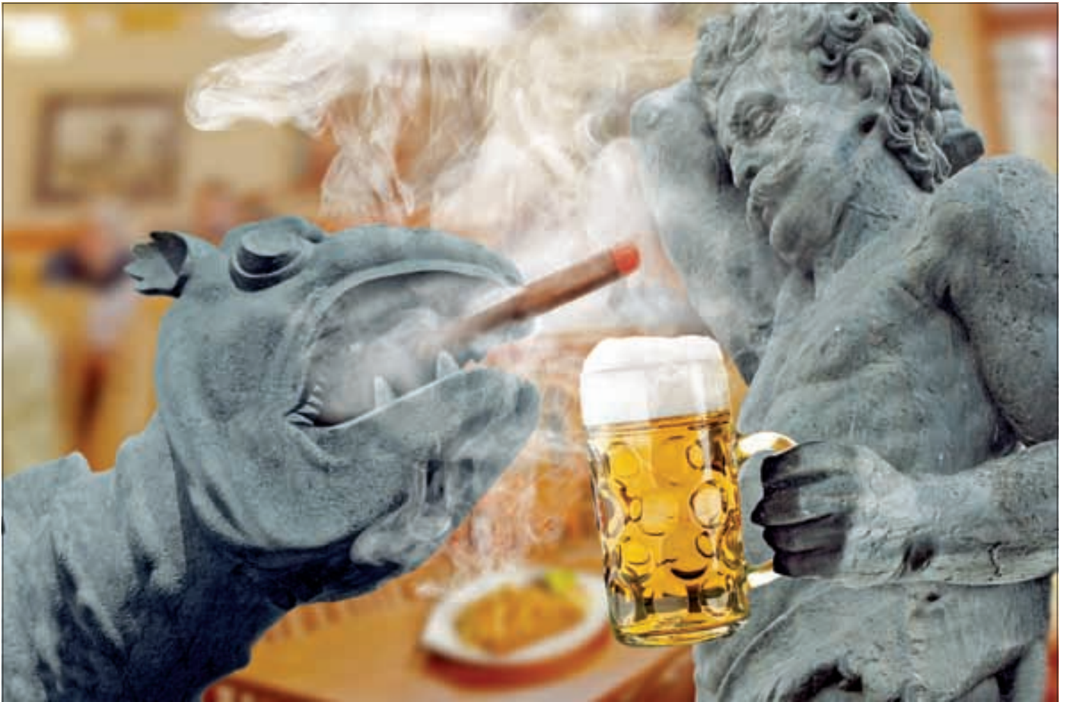
Starker Tobak: Beisl-tour in Klagenfurt