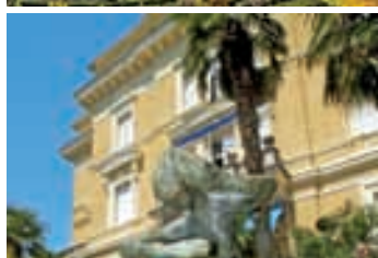
Hotel Miramar in Traumlage Fischerhafenidylle in Volosko Abendromantik am Lido Meerterrassen des Miramar Schöne Aussichten garantiert Florale Kunststücke in Opatija Skulptur vor der Villa Amalia