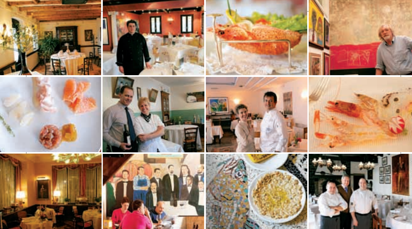
Ein fotografischer Streifzug durch Friauls beste Restaurants und Osterie: Der kulinarische Bogen spannt sich von einfacher Regionalität bis zu italienischer Haute Cuisine